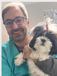
MV Fabio Issa

Graduado em Medicina Veterinária pela FMU, onde também realizou residência em clínica médica de pequenos animais. Possui pós-graduação em clínica médica e cardiologia. Faz parte do corpo clínico do Pet Care Morumbi desde 2006. Realizou pós-graduação em endoscopia veterinária pela Anclivepa e atualmente é integrante do serviço de endoscopia do Grupo Pet Care.